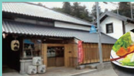
旭鶴酒造工場見学