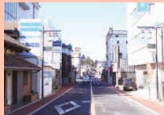
城下町の商店街活性化に対する取組み